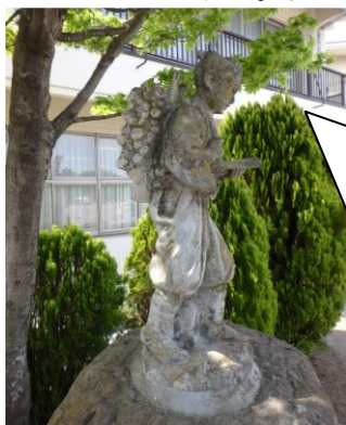
① 校門横の 二宮尊徳 (金次郎) の像 (昭和16年 に建立)

このように、敷地内には、たくさんの宝物があります。その時代の地域のみなさんの思いや願いが込められたものばかりですね。他にもあったら、校長先生に教えてくださいね。