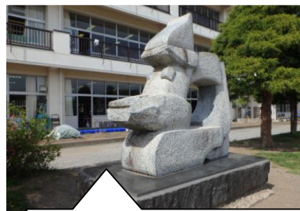
③ 校庭の「風に向かう」 (平成元年に本校百年 記念事業で建立)