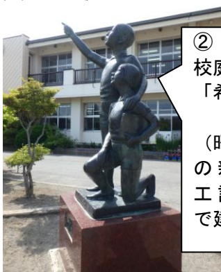
② 校庭の 「希望の像」 (昭和61年 の新校舎竣 工記念事業 で建立)