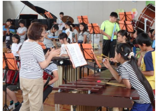
音楽専科、学級担任と一緒に指導(4年生)