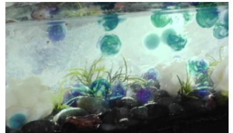
6年西組が製作した幻想的な図工作品 宮沢賢治の「やまなし」ドーム↑