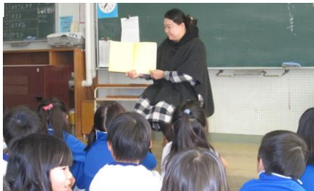
読書旬間中のお母さんの読み聞かせ↑ ご協力、ありがとうございました。