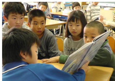
読書旬間中の姉妹学級の読み聞かせ↑