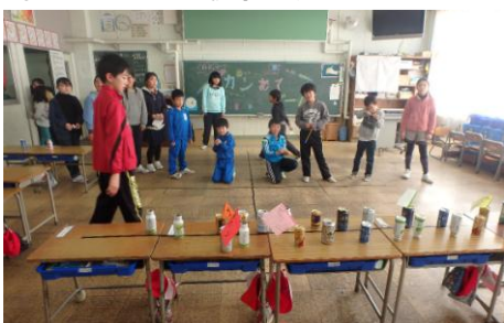
全校で楽しんだ「児童会祭」↑