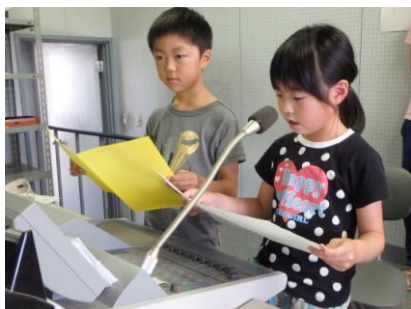
↑ 2年生が2学期の決意をしっかりと発表してくれました。