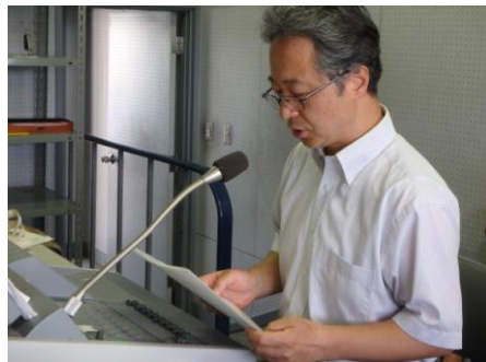
↑ 体育館工事のため、放送による始業式でしたが、各教室できちんとお話しに耳を傾ける子どもたちの姿がありました。

まだ暑い日もありますが、熱中症などにならないように、体調に気をつけて毎日を過ごしましょう。