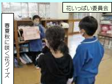
花いっぱい委員会