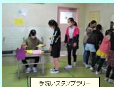
手洗いスタンプラリー