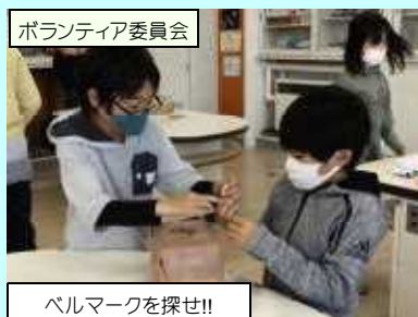
ボランティア委員会