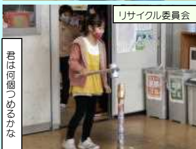
リサイクル委員会