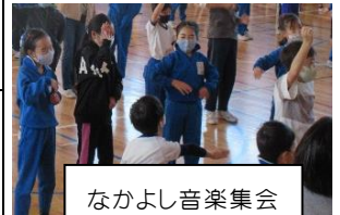
なかよし音楽集会