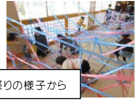
児童会祭りの様子から