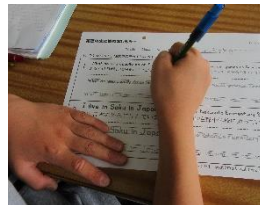
表現のなぞり書きをして文字でも確認