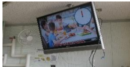
デジタル教科書の活用