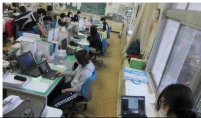
職員間で教え合う ICT 研修